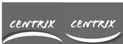
图4 研究3正/负面标识刺激物示意

对于服务来说，表情需要通过品牌标识来展示。品牌标识视觉设计会影响消费者对品牌和产品的整体印象(Henderson & Cote, 1998; Henderson, Giese, & Cote, 2004)。例如对称弧线容易让消费者联想到嘴，并通过弧线的弯曲方向来判断表情的正面与负面(Yuki et al., 2007)。因此在研究3中，研究者借鉴谢志鹏和汪涛(2017)的研究，设计了虚拟品牌“Centrix”(见图4)。