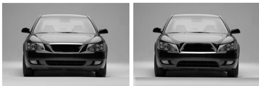
图2 研究2 正/负面产品表情刺激物示意

前文提到, 高自主的个体会忽视社会期待和规则, 按照自己的意识行事(Warren & Campbell, 2014), 这样的个体会显得更加独立和叛逆, 同时也容易因为特立独行的风格与主流社会产生一定的距离(Liberman & Trope, 2010)。相比之下, 低自主程度的个体行为会更容易预测, 并且更加清晰, 因为他们会遵守社会准则以及外界期待, 他们的行为模式更容易被他人理解和预测, 因此与他人的社会距离会相较高自主个体更近。社会距离(social distance)指的是社会客体与个体之间关系以及行为的亲疏或明确性(Bar-Anan, Liberman, & Trope, 2006), 它是心理距离的重要决定因素。基于以上推理, 研究者认为产品正面/负面表情会引