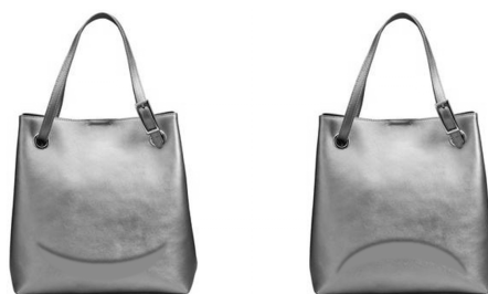
图3 研究3正/负面产品表情刺激物示意

在产品设计上,本研究采用了和研究2相同的方法,使用弧形几何元素来操纵被试的表情感知。被试挑选了一款在设计上没有明确风格和特色的拎包,在代表正面表情的产品上,研究者加入了两端上扬的弧形装饰;而在代表负面表情的产品上,研究者加入了两端下沉的装饰。除此之外,两款设计没有任何不同。为了避免被试受到品牌和颜色的干扰,研究者对图像进行了灰度处理,并且隐藏了品牌信息(见图3)。