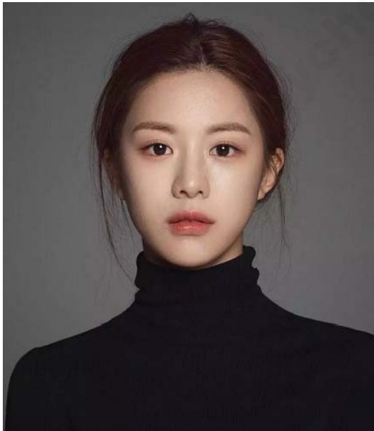
女性吸引力威胁组材料