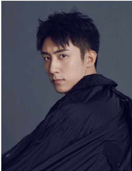
男性吸引力威胁组材料