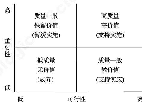
图1 建言质量四象限图

建言内容的“重要性”和“可行性”反映了建言的优劣程度。因此,如图1所示,我们根据评价建言质量的“重要性”和“可行性”两个维度划分出四个象限:即建言涉及的问题非常重要且可行性强为高质量,表明建议内容对企业而言具有高价值,应该支持实施;建言涉及的问题不重要且可行性低为低质量,表明建议内容对企业没有什么价值,可以不予考虑;建言涉及的问题非常重要但可行性低,视为质量一般,表明建议内容对企业具有保留价值,可以待时机成熟再执行;建议涉及的问题不重要但可行性强,建议质量一般,表明建议内容对企业有一些微小价值,如企业日常的小改进,可以支持实施。